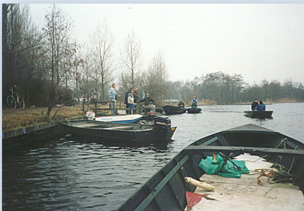
Vuilruimen 80er jaren

Op 22 maart 2025 van 09:00 uur tot 12:00 uur zal in het kader van Vang5 een vuilruimactie worden georganiseerd. Deze actie valt samen met de nationale actie. Aan onze actie doen Landsmeer Schoon en Landschap Noord-Holland mee. Een en ander