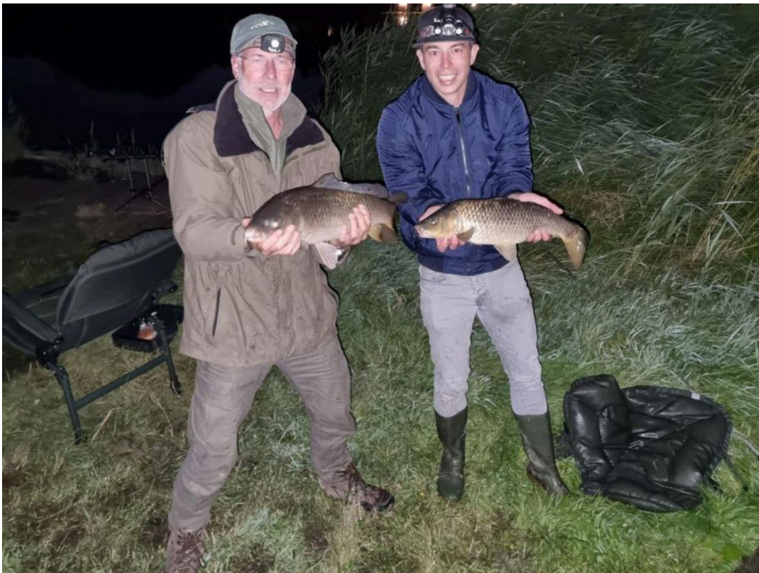
De foto van de maand augustus.

De komende Algemene Ledenvergadering zal voorgesteld worden de statuten te wijzigen. Dat is noodzakelijk in verband met de nieuwe wetgeving. Deze wetgeving stelt nadrukkelijk verantwoordelijkheden vast. Hierdoor was het noodzakelijk de statuten aan te passen en dat schepte meteen de mogelijkheid ze aan te passen aan de moderne tijd. Op verzoek zullen de concept statuten aan u kunnen worden verzonden. Hierbij is het van belang dat u aangeeft uw lidmaatschapsnummer van de vereniging. Uiteraard ook uw naam en achternaam. De aanvraag kan worden gedaan op ons algemeen emailadres : info@hsv-landsmeer-denilp.nl