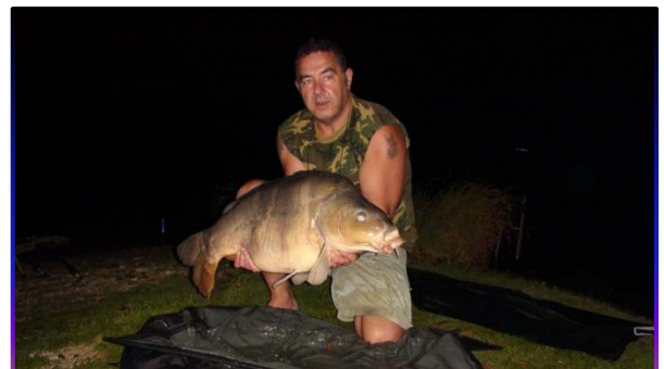
Spiegelkarpers 39 pond gevangen in Frankrijk

Wij zijn van plan die aan het eind van het eerste kwartaal te houden. Volg onze Facebookpagina dan ook nauwkeurig.